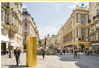
Abb 2: Quantitative Easing (for the street)