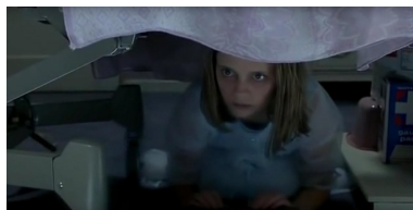
© The Sixth Sense, M. Night Shyamalan (1999) Hollywood Pictures, Trailer