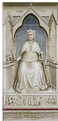
Giotto, Justitia in der Scrovegni-Kapelle/Padua

Dabei ist es nicht wirklich verwunderlich, dass ausgerechnet das Mädchen in die Rolle der Kommunikatorin des Justizsystems schlüpft. Bereits seit der Entstehung des Mythos um Justitia - oder Lady Justice , wie sie in den Vereinigten Staaten genannt wird - steht das Mädchen in Weiß in enger Verbindung mit dem demokratischen Gerechtigkeitsystem. Doch während Lady Justice als ruhige, faire Richterin dargestellt wird, wurde das Bild des rechtsuchenden Mädchens, das im gespenstischen Leintuch gehüllt Gerechtigkeit sucht, kontinuierlich blutverschmierter in ihrer Darstellung. Angesichts des engen Rahmens dieser Publikation können nicht alle komplex miteinander verknüpften Ursachen, die zu dieser Entwicklung führten, ausführlich besprochen werden. Obwohl die Popularität des gerechtigkeitseinerfordernden Mädchens gegenwärtig in einer Vielzahl von Medien zu beobachten ist, werde ich mich im Folgenden auf das Medium Film und speziell auf das Horrorgenre fokussieren. Anliegen dieses Aufsatzes ist es, die Relationen zwischen der Entwicklung des Mädchens als gegenwärtig populäre rechtsvermittelnde Figur im Film und in einer Reihe von US-amerikanischen Gerichtsentscheidungen seit den 1990er Jahren aufzuzeigen und damit eine augenfällige Lücke filmwissenschaftlicher Studien zu füllen.