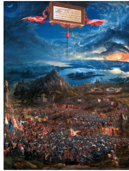
Abb. 7: Altdorfer, Albrecht: Schlacht bei Issus Alte Pinakothek/München

Abschließend mag in diesem Sinne noch an zwei weitere Unterscheidungen erinnert werden, die in der französischen Wissenschaftsgeschichte getroffen wurden: Einerseits die Differenz von Strategie und Taktik in der Soziologie der Praxis von Michel de Certeau und andererseits das Konzept des Bürgerkriegs bei Foucault: