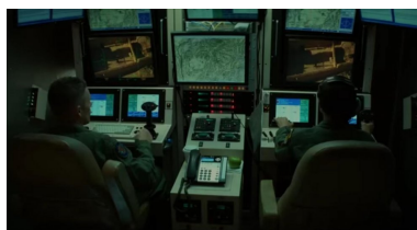
Abb. 2: Good Kill, Andrew Nicol (2014)

Dispositiv [5] ist ein Begriff, den Michel Foucault für die Gesellschaftsanalyse entwickelt und dem er vor allem eine strategische Funktion beigemessen hat. Er verwendet ihn vor allem für jene Analyse, die sich mit der Regierung der Menschen beschäftigt. Foucault umschreibt das Dispositiv mit folgenden Worten: