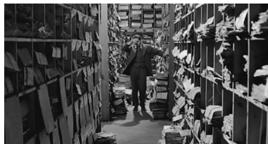
Abb. 1: Kafka, Steven Soderbergh (1991)

Michel Foucault: Der Wille zum Wissen. Sexualität und Wahrheit