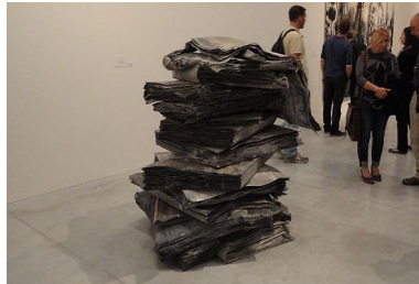
Abb. 4: Ausstellungseröffnung Anselm Kiefer

Was Michel Foucault unternommen hat, besteht vor allem darin, eine Gesellschaftsanalyse und -geschichte mittels Macht- und Wissensformen zu beginnen, die sich nicht nur fortsetzen lässt, sondern deren Elemente immer wieder neu analysiert und angeordnet werden können. Denn jede Gesellschaft wird immer wieder eine spezifische Rekombination von Machtformationen vornehmen (müssen), teilweise um wiederholt disruptive Effekte zu produzieren und mittlerweile auch schon allein deshalb, weil in ihrer Ökonomie um Aufmerksamkeiten unbedingt mediales/soziales Kapital akkumuliert werden muss. Allerdings wird es immer schwieriger klare Abfolgen und Verläufe in eine Erzählung zu hegemonialen Machtformen als Gesellschaftsanalyse zu bekommen. Der zentrale Zukunftsanker für diese Erzählung scheint ziemlich verrutscht zu sein und gerade deshalb ist die Bestellung des Foucaultschen Archivs so bedeutsam, weil dadurch die Befähigung zu einer widerständigen Rede entsteht, welche die losen Enden der Gesellschaftsgeschichte wieder aufzunehmen in der Lage ist. So lässt sich zumindest eine Situationsanalyse der scheinbar orientierungslosen Gewalten und Mächte unternehmen, die - im Sinne einer Zivilisationsgeschichte - eben keine Entwicklungslinien mehr erkennen lassen.