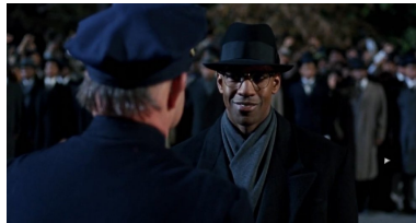
Abb. 3: Malcolm X, Spike Lee (1992)

revolutionärer Pol, der den Fluchtlinien des Wunsches folgt, durch die Mauer bricht und Ströme fließen läßt, seine Maschinen und fusionierenden Gruppen in den Enklaven oder an der Peripherie aufstellt und in allem umgekehrt zu Werke geht als der erste Typ: Ich bin keiner der Euren, ich bin auf ewig von niederer Rasse, ich bin ein Tier, ein Neger." [11]