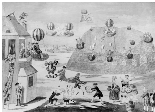
Abb. 1: Hieronymus Löffelkohl, Folgen von der Erfindung der Luftkugeln

Diese ungewohnt rasche und umfassende Reaktion des Königs auf die bürgerliche Erfindung (vgl. Stoffregen-Büller 1983: 41f) erklärt sich zum guten Teil aus dem Umstand, dass diese das Potenzial einer Revolution in sich trug, zumindest was ihren symbolischen Effekt auf die Bevölkerung betraf. Die unzähligen Berichte, Abbildungen und Prunkobjekte, die die Anfänge der Aeronautik begleiteten, bezeugen den überwältigenden Eindruck, den sie kollektiv machte, das Gefühl der 'Weltbewegung' (Goethe), das mit ihr einherging. Endgültig schien der Himmel von den jahrhundertealten Zeichen eines allmächtigen Souveräns befreit, der über allem waltete. Es waren nicht mehr höhere Gewalten, die den Menschen 'von oben her' heimsuchen konnten, sondern der Aktionsradius der Bürger hatte sich 'von unten her' schlagartig ausgedehnt. Mit dem Aufstieg in die dritte Dimension stand plötzlich der vormals undenkbarer Gedanke im Raum, sich ohne Zugriffsmöglichkeiten über sämtliche irdischen Grenzen hinwegzusetzen und, wie Jacques Alexandre César Charles bei seinem ersten Flug erwo, selbst dem König einen kurzfristigen Besuch abzustatten.